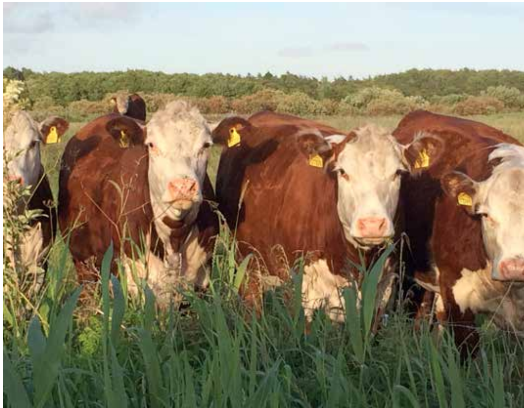
Tabel 2- 16 mdr.s kvier slagtet fra græs

De 4 kvier har ikke de højeste 365 dags vægte. De er i gennemsnit ca. 40 kg lettere ved 365 dags vægten end kvierne vi har færdigfodet, så reelt burde der kun være ca. 20 kg forskel på krogvægten, hvis deres tilvækst på græs havde været ens med kvierne på stald. Men krogvægten er 60 kg mindre på tabel 2 kvierne i forhold til kvierne i tabel 1, der er færdigfodet. Kvierne i tabel 2 har manglet færdigfødning og dette kvitteres direkte i en lav afregning. Se tabel 2.