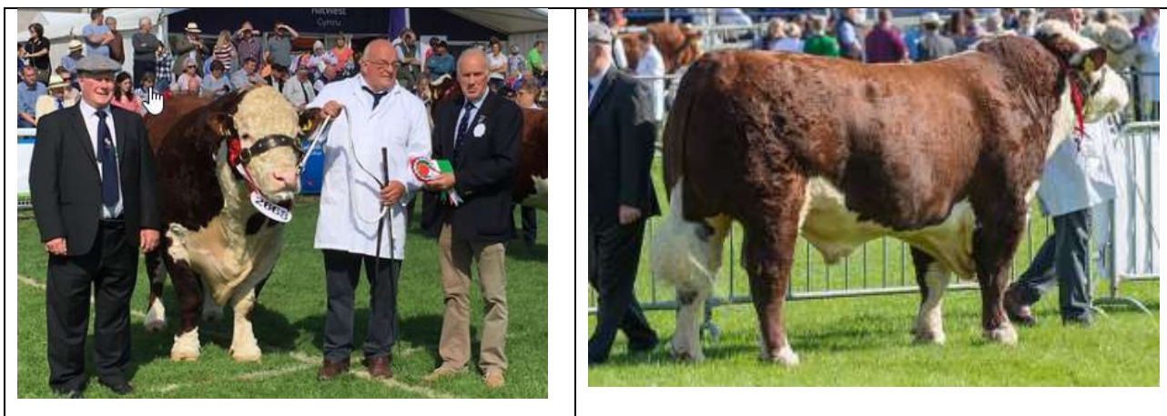
Foto af Bakgaard Keno, født 21.11.2014, knap 3 år.

Alle disse nyttige oplysninger kan findes i CHR registret under kvæg.